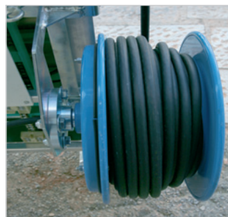
A-con avvolgicavo elettrico