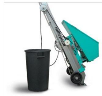
B-con raccoglitore cavo